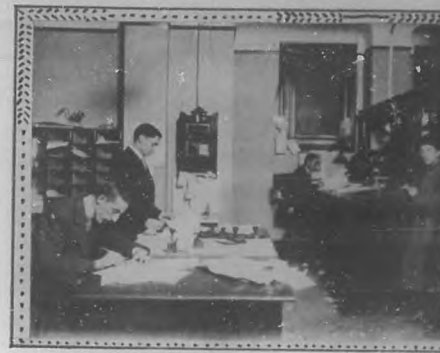
DEPARTAMENTO DE FACTURAS

do presente se han zanjado siempre satisfactoriamente todas las dificultades que se han presentado. Así, en grandes rasgos hemos creído oportuno dar á co-