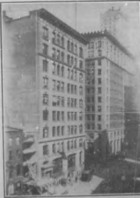
EDIFICIO OFICINA CONSULAR No. 90-96 Wall Street.

Se certifica un promedio de 7,000 facturas mensualmente; en igual término se despachan 55 buques, y se hacen 140 legalizaciones de firmas é infinidad de otras certificaciones y documentos que sería difícil mencionar. Las consultas