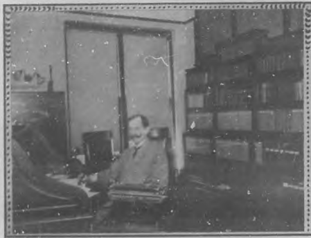
DESPACHO DEL CÓNsul GENERAL Y BIBLIOTECA