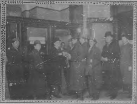
DEPARTAMENTO DE FACTURAS.—PÚBLICO ESPERANDO LAS MISMAS.

do cubano que necesita cualquier servicio: al enfermo, al rico, al pobre, á todos por igual.