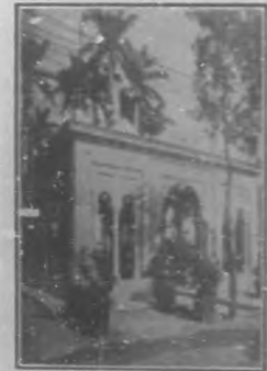
PABELLÓN "LAS VILLAS"

Se recuerda á los señores abonados que el pago de la suscripción mensual ha de ser adelantado para poder entrar en el sorteo correspondiente.