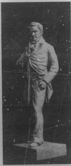
El Exímio Publicista José Antonio Saco.