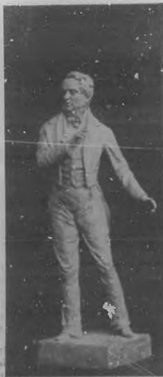
El Gran Poeta José María Heredia.