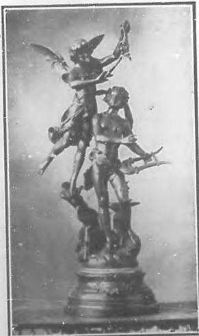
Premio especial otorgado por el Honorable Presidente de la República, á propuesta del Jurado, á la Banda Infantil de Calbarán en el concurso celebrado en la Exposición Nacional.

Por la prensa diaria se anunciará el día fijo.